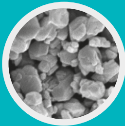
APYRAL® 40 VS1

Vinylsilanbehandeltes, mineralisches Flammenschutzmittel Vinyl silane treated mineral flame retardant